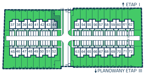
↑ ETAP I

POWIERZCHNIA LOKALU 44 94,46m 2 ogród 89,37 m 2